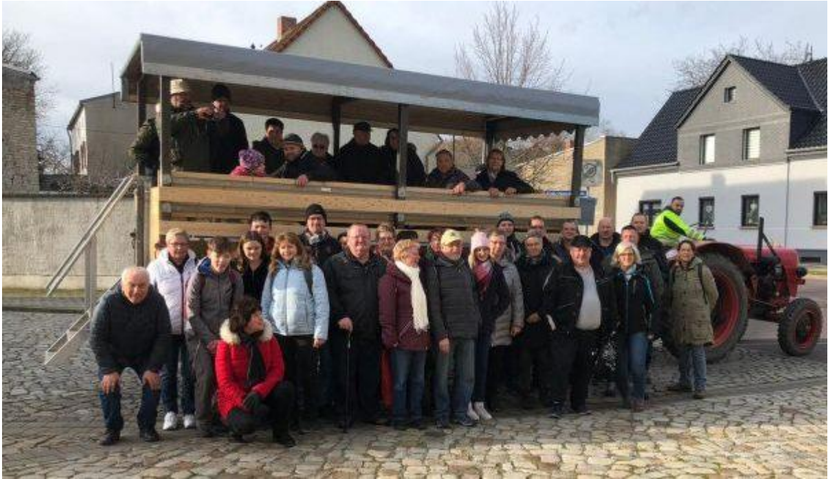
Abbildung 1 – Der HVG kurz vor der Grünkohlwanderung – solche Gemeinschaftsbilder gab es nicht viele in 2020 ...