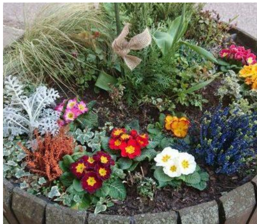
Abbildung 2 - Auch wenn in 2020 nicht viel ging, die Blumen in den Kübeln haben geblüht.