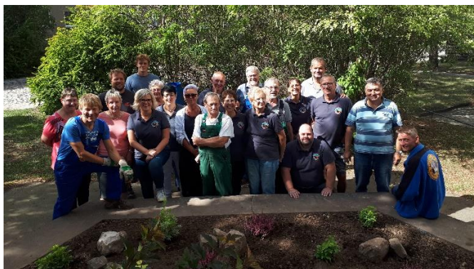
Abbildung 3 – „Mitmachen statt Meckern“ mit dem MDR in Glöthe