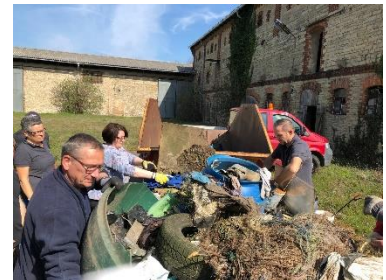
Abbildung 2 - Putzaktion "Park und Feldwege"