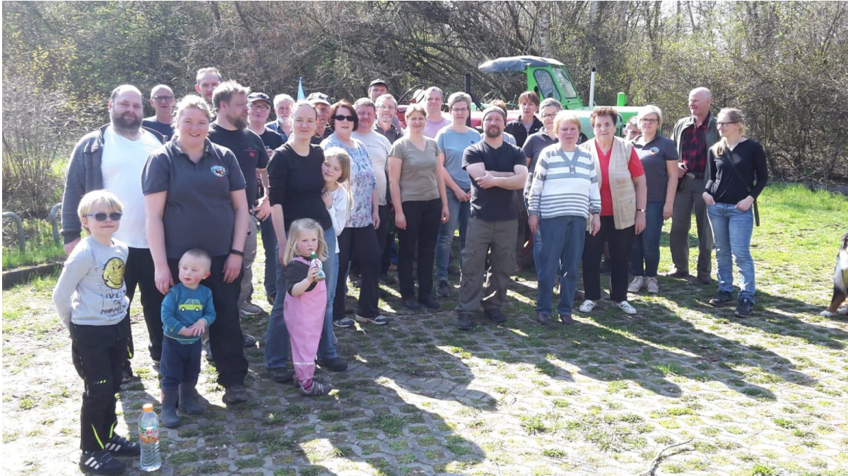
Abbildung 1 – „Wir packen an, denn unser Umfeld ist uns wichtig“ – ein paar Mitglieder bei einer Putzaktion im Park