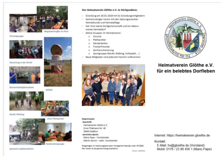
Abbildung 5 - Seite 1 des Vereinsflyers (ungefaltet)

Ein Nebenprodukt dieser Bewerbung war ein Informations-Flyer über den Heimatverein Glöthe e. V., der bei den verschiedenen Veranstaltungen ausgelegt bzw. verteilt werden konnte.