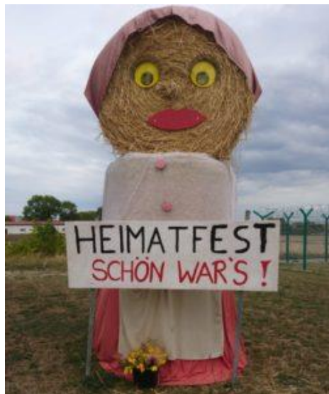
Abbildung 2 - Grete, eines von den zwei Heimatfestmaskottchen

2018 lieferte die AG Handarbeiten die Garderobe für die beiden Heimatfest-Maskottchen „Gerda“ und „Grete“.